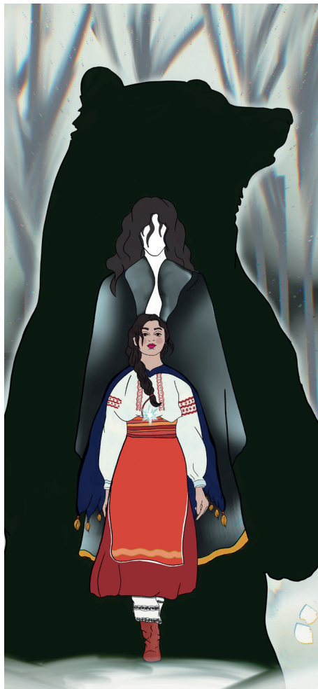
rys. Aleksandra Pochmara

Bardzo interesujący jest emancypacyjny przekaz powieści. Wasilija jest niezwykle dziewczynką, a jej dążenie do niezależności i odrzucanie schematycznych zasad funkcjonowania w społeczeństwie są bardzo silnie zaakcentowane. Na Wasi obowiązujące w tamtych czasach ograniczenia i normy nie robią wrażenia, nie wyobraża ona sobie życia według tak bezsensownych według niej zasad. Budzi to niepokój wśród jej rodziny a także kontrowersje w lokalnej społeczności, ponieważ w opisywanych czasach kobiety żyły zgodnie z jednym z dwóch scenariuszy: zamążpójście albo klasztor. Żadna z tych dróg nie występuje w wyobrażeniach o przyszłości młodej Wasilii. Dziewczynka zain-