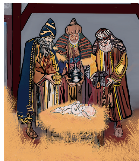
rys. Aleksandra Pochmara

W historii o Trzech Królach nic nie jest pewne, poczynając od istnienia samych bohaterów tej opowieści po tajemniczą gwiazdę spełniającą