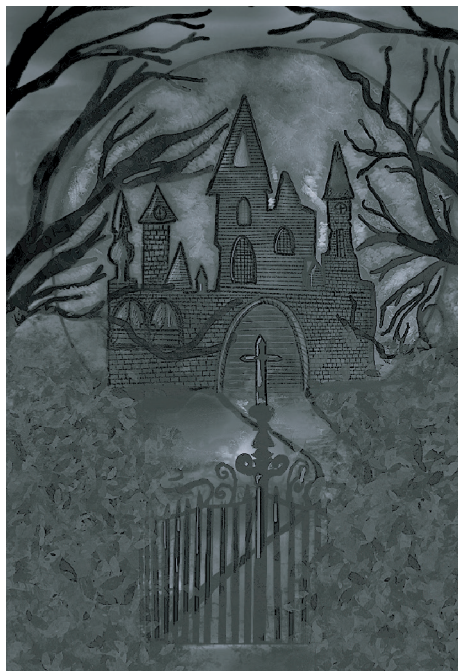
rys. Aleksandra Pochmara

nastrój, zwłaszcza gdy czyta się je zimową porą, kiedy to noc wciąż dominuje nad dniem.