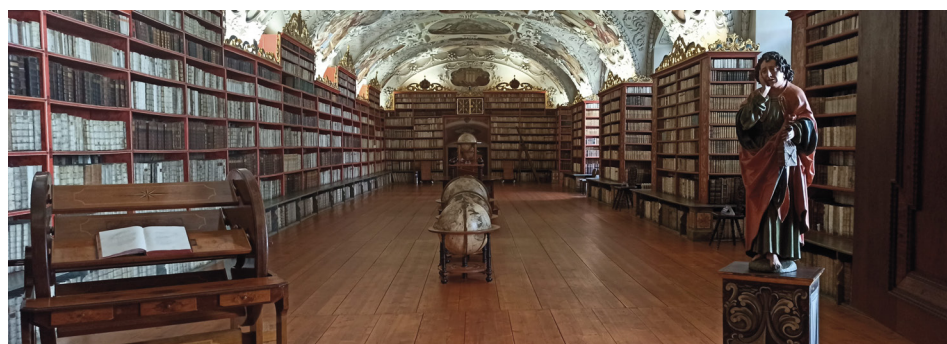
Biblioteka na Strahovie

W Sali Teologicznej znajduje się około 20 tysięcy wolumi-