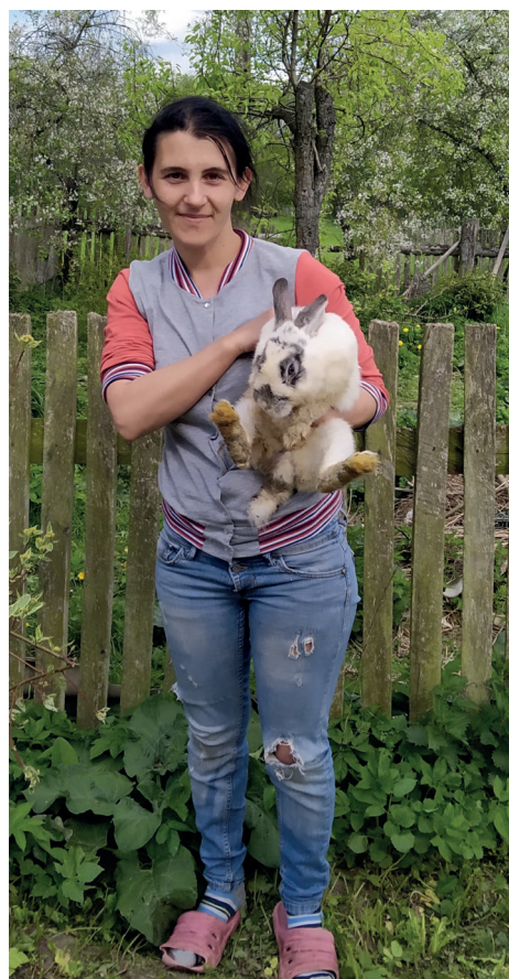
Kobieta z mazowieckiej wsi

Autorki wyruszają w trasę po mazowieckich wsiach – bez planu podróży, za to z wielką ciekawością jej mieszkańek. W rozmowach z przypadkowo spotkanymi kobietami chcą skonfrontować swoje wyobrażenie dzisiejszej wsi