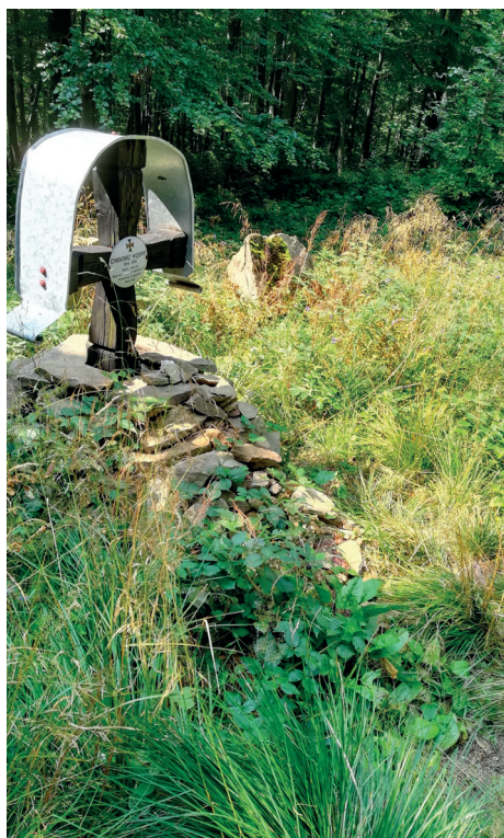
Cmentarz z I wojny światowej, okolice góry Chryszczata

Kiczery to zbiór anegdot i wspomnień, wędrowka po znanych szlakach turystycznych, ale też „własnych ścieżkach”. Czytel-