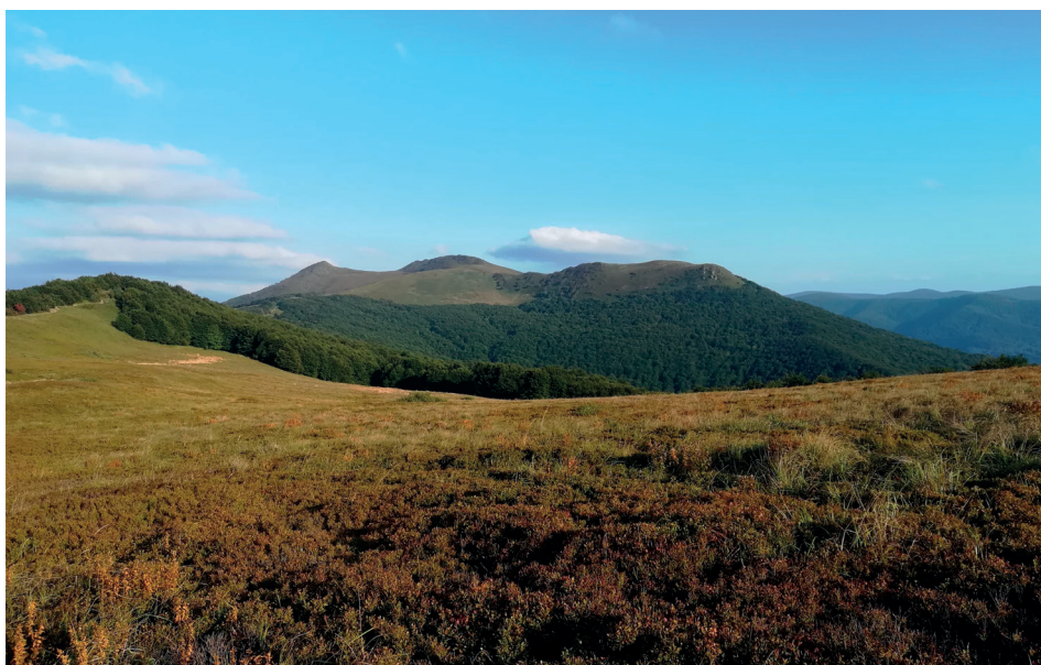
Połonina Wetlińska