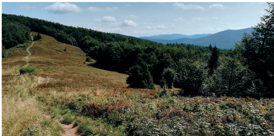
Czerwony szlak turystyczny na Wielkie Jasło, fot. Grzegorz Kaczmarek

nik znajdzie tu wiele ciekawych wątków, takich jak np. greckie osadnictwo w Krościenku czy mit polskiego Dzikiego Wschodu. Z jednej strony Robiński weryfikuje bieszczadzkie mity, ale zarazem podtrzymuje aurę magicznych Bieszczad. W swojej książce przedstawia wiele interesujących faktów związanych zarówno z historią, jak i najnowszymi dziejami Bieszczad.