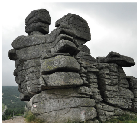
Sudety, fot. pixabay.com

jego kultury i sztuki, fauny i flory, a także znanych ludzi związanych z Sudetami. Kolejnym rozdziałem, moim konikiem, są trasy po każdym pasmie górskim. Zaprowadzą Was one w: Góry Izerskie, Karkonosze, Góry Kaczawskie, Rudawy Janowickie, Góry Kamienne, Góry Wałbrzyskie, Góry Sowie, Góry Bardzkie, Góry Stołowe, Góry Bystrzyckie, Góry Orlickie, Masyw Śnieżnika, Góry Bialskie, Góry Złote, Góry Opawskie. Piękno poszczególnych pasm ciężko opisać w kilku zdaniach czy zmieścić w krótkim opisie trasy. Dlatego najlepiej zobaczyć je na własne oczy! Dopełnieniem lektury jest rozdział Atlas od A do Z . Poznacie w nim wszystkie najważniejsze miejsca Sudetów, które warto odwiedzić. Przewodnik uzupełniają mapki i kolorowe zdjęcia. Niektóre z nich są mojego autorstwa. Zapraszam do lektury i... wyprawy w Sudety.